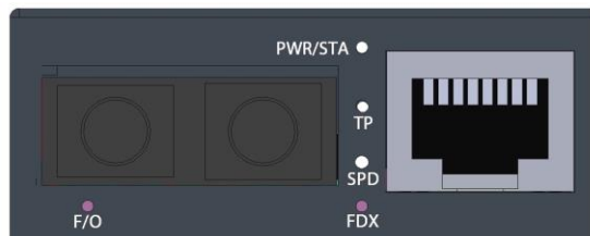
図 1. 2心ファイバタイプの前面パネル