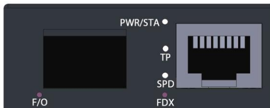
図 2. WDM及びSFPタイプの前面パネル