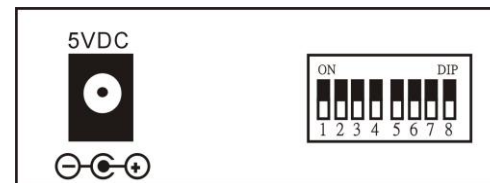
図 3. 後面パネル